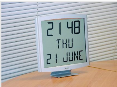
Cristalys Date auf einem Tischträger