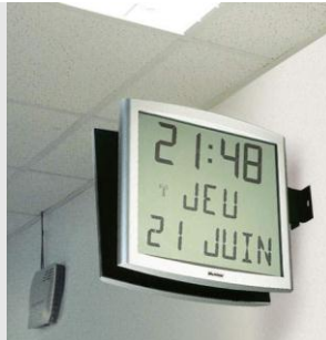
Cristalys Date auf einem doppelseitigen Träger